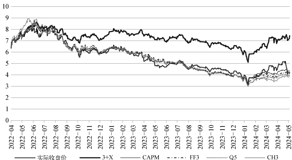
图2 多因子模型对比

个股系统性风险的捕捉能力,基础的市场因子依然占据主导地位。对比 CAPM、FF3、Q5 和 CH3 四条拟合曲线,它们在整个测算周期内几乎纠缠在一起,未出现结构性的分化。无论是简单的 CAPM 还是复杂的 Q5,其对“正常股价”的预测轨迹大体相同。这意味着,对于 ST 盛屯而言,模型选择的差异在最终结果上影响甚微,各学术模型之间具有很高的内部一致性。